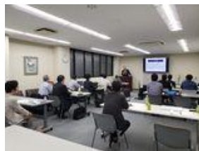
国内最高レベルの講師による実践的な経営手法研修