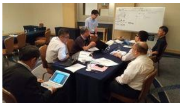
異業種のリーダー達とのチーム研究