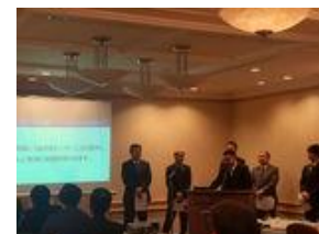
参加企業の社長・役員を招待してチーム研究の成果を披露