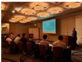
現役トップの経営者を講師に招聘