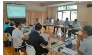
1泊2日の合宿で絆を深め、研究を深化